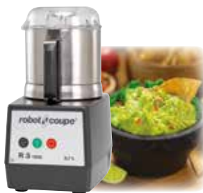
R 3-1500 650 Watts 1 500 giri/min.