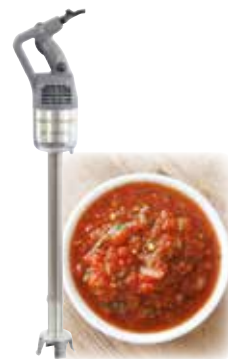
MP 550 Ultra 750 Watts 9000 giri/min.