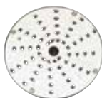
28058 Julienne 3 mm