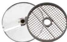
28112 Kit cubetti da 10 mm