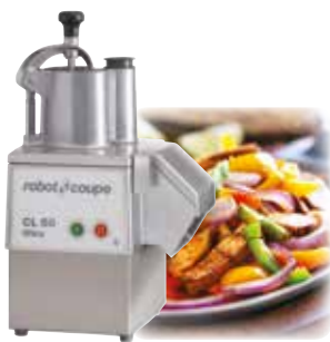
CL 50 Ultra 550 Watts 375 giri/min.