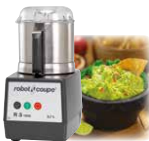
R3-1500 650 W 1500 ot/mn