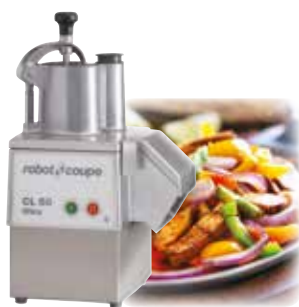
CL 50 Ultra 550 W 375 ot/mn