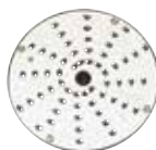
28059 Strouhač 5 mm