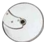
28065 Plátkovač 5 mm