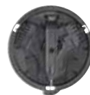
39881 zařízení na čišění kostiček 5,8 a 10 mm