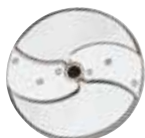
28064 Plátkovač 3 mm