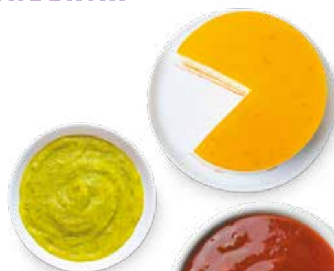
Coulis e puree