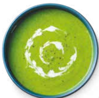
Zuppe e vellutate